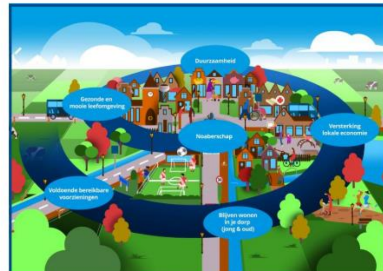
Spiraal van versterking (Provincie Overijssel)